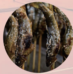
鮎焼き 海鮮食べ尽くし