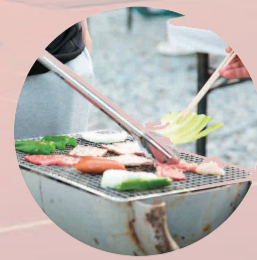
地元の名産を使った BBQ (18日晩)