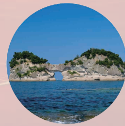
早朝クルージング体験 (19日朝)